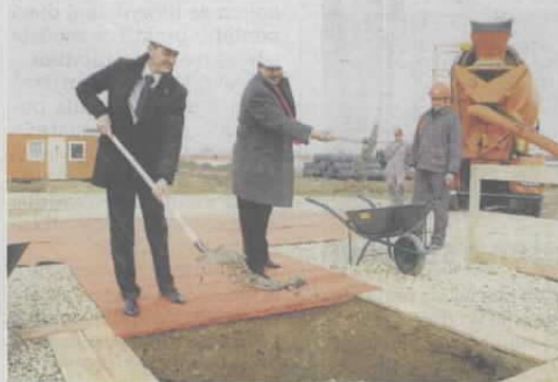
Položanje kamena temeljca. Centar se otvara u proljeće 2011.