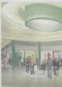
Vizualizacija dijela interijera

– Atraktivna lokacija, izvrsna infrastruktura, moderan koncept kao i iskusan tim koji sudjeluje u ovom projektu dovoljno su jamstvo da možemo reći da centar Lumini ima sve preduvjete da postane odredište sjevera Hrvatske i za šoping i za zabavu – zaključio je Domagoj Pavlek, direktor razvoja projekata u Verdisparu. (bc)