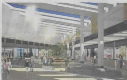
Svi sadržaji bit će na jednoj etaži radi lakše komunikacije

Unutar trgovačkog centra bit će više od 80 trgovina, prvi u regiji Cinestar mul-