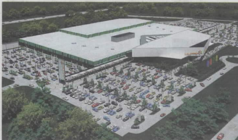
Verdispar je otkupio zemljište od 102.000 m 2 za objekt koji će imati 33.000 m 2 i mogućnost širenja

Trgovačko-zabavni centar Lumini imat će više od 80 trgovina, restorane, kafeterije te Cinestar multipleks sa šest kinodvorana, prvi u tom dijelu Hrvatske